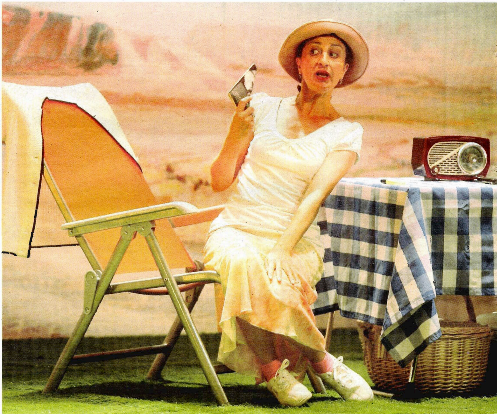
Una de las actrices protagonistas, durante la representación que llega hoy al Gran Teatro de Córdoba